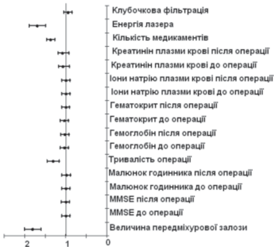
Рис. 1. Форест-графік мета-аналізу впливу лікування за допомогою КТФ-лазера доброякісної гіперплазії передміхурової залози на показники: когнітивних функцій за MMSE, тестом малювання годинника; крові за гематокритом, рівнем гемоглобіну; водно-сольового обміну за концентрацією іонів натрію в плазмі крові; функції нирок за рівнем креатиніну плазми крові, швидкістю клубочкової фільтрації; даних клініко-інструментальних обстежень за величиною передміхурової залози, енергії лазера, кількості спожитих медикаментів, тривалості операції у пацієнтів вікової групи 61–75 років порівняно з віковою групою пацієнтів 50–60 років. Контроль для всіх досліджень (вікова група пацієнтів 50–60 років) представлено у вигляді вертикальної лінії та прийнято за 1

мінімальні значення MMSE, малювання годинника, рівня гемоглобіну, гематокриту в пацієнтів у віці 76–90 років пояснюються віковими інволютивними змінами та зниженням адаптаційних резервів організму. Цим пояснюється також той факт, що група пацієнтів віком 76–90 років отримувала максимальну кількість медикаментів. Отже виявлені відмінності у пацієнтів 50–60 років, 61–75 років, 76–90 років обґрунтовує доцільність запропонованого методичного підходу щодо аналізу впливу оперативного лікування доброякісної гіперплазії передміхурової залози за допомогою КТФ-лазера на показники когнітивних функцій, системи крові, водно-сольового обміну [1] та функції нирок [3, 4, 5] у зазначених вікових групах пацієнтів. Відсутність відмінностей після проведення оперативного лікування доброякісної гіперплазії передміхурової залози за допомогою КТФ-лазера