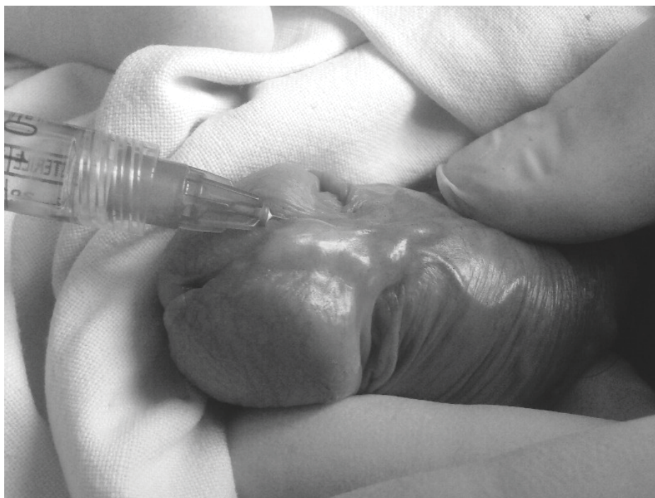
Рис. 3. Введение геля гиалуроновой кислоты

Результаты лечения в группах представлены в таблице 1.